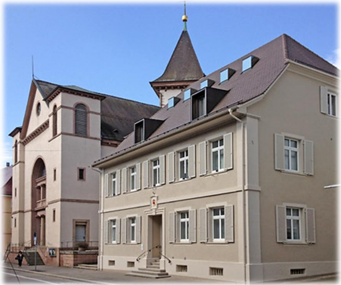
Haus der Kirche, Basler Str. 147